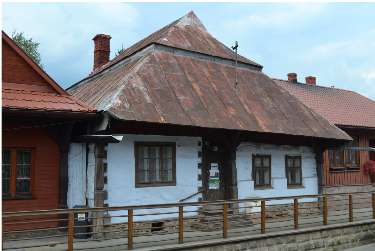
Zakliczyn, gmina Zakliczyn – Muzeum Grodzkie „Pod Wagą”

Kościół pw. św. Idziego Opata zbudowano w latach 1739-1768 w stylu barokowym. Do kościoła przylega kaplica renesansowa z przełomu XVI/XVII w. z późnobarokową polichromią. Portal do zakrystii i murowany ołtarz prawdopodobnie pochodzą z zamku w Melsztynie. We wnętrzu kościoła zwraca uwagę rokokowy wystrój i wyposażenie, na które składają się ołtarz główny, cztery ołtarze boczne, ambona i konfesjonał. W ołtarzu głównym znajduje się obraz Matki Bożej z Dzieciątkiem. Przy kościele znajduje się cmentarz, również wpisany do rejestru zabytków.