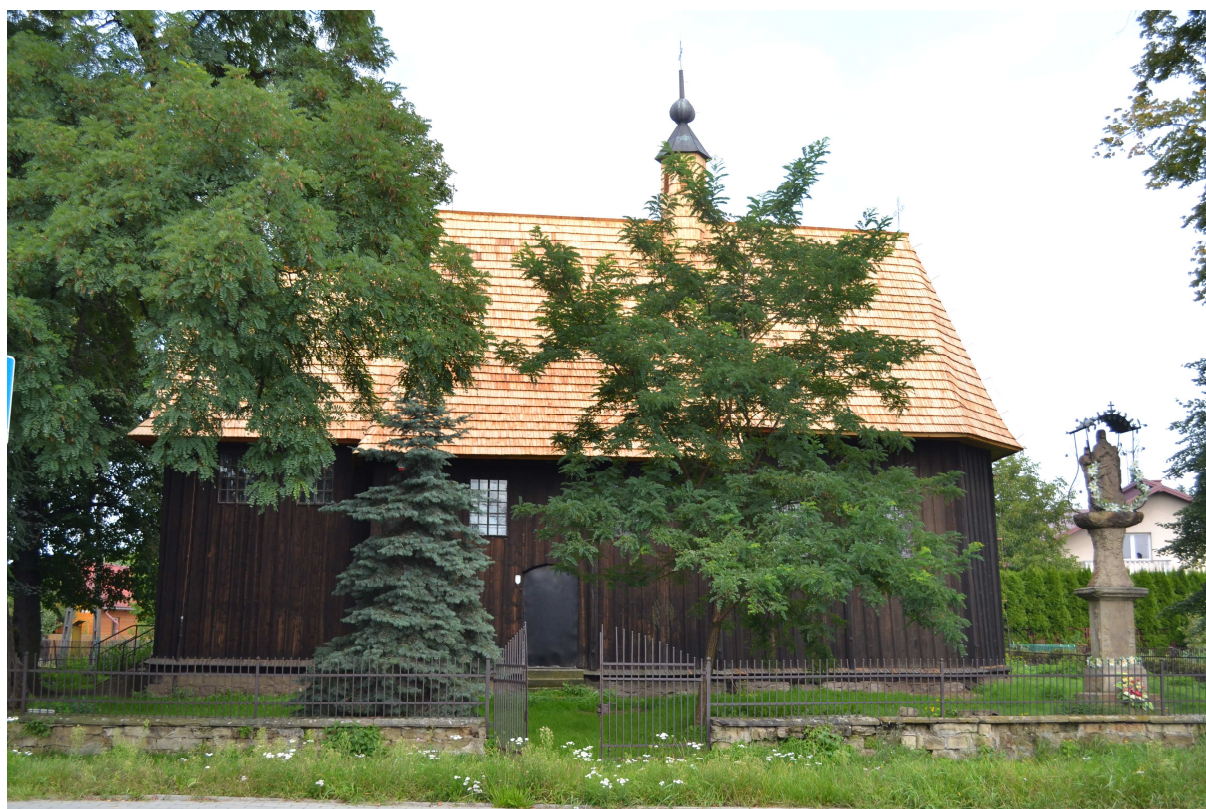
Wojnicz, gmina Wojnicz – XVII-wieczny kościół pw. św. Leonarda z XIX-wieczną kapliczką

Bez wątpienia zabytkiem wartym uwagi jest kościół pw. św. Leonarda z XVII wieku . Kronikarze podają jednak, iż już na początku XIII wieku w tym samym miejscu istniał inny kościół. Obiekt jest przede wszystkim interesujący ze względu na drewnianą, zrębową konstrukcję. Wnętrze jednonawowego budynku utrzymane jest głównie w stylu neorenesansowym – ołtarz główny, w którym znajdują się renesansowe obrazy z drugiej połowy XVI wieku oraz dwa ołtarze boczne z obrazami z XIX wieku. Na dachu dwuspadowym, krytym gontem, wznosi się niewielka wieżyczka, a nieopodal kościoła znajduje się kapliczka z końca XIX wieku.