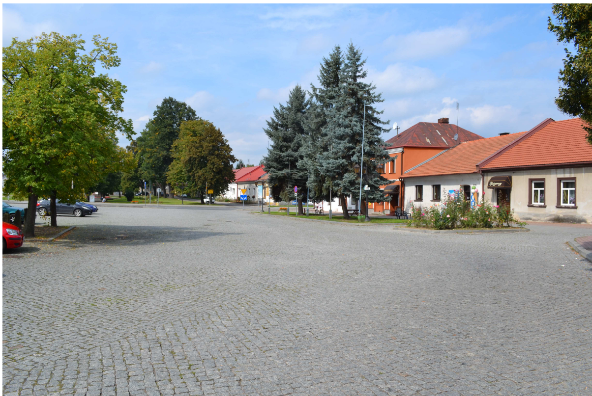
Wojnicz, gmina Wojnicz – zabytkowy układ urbanistyczny