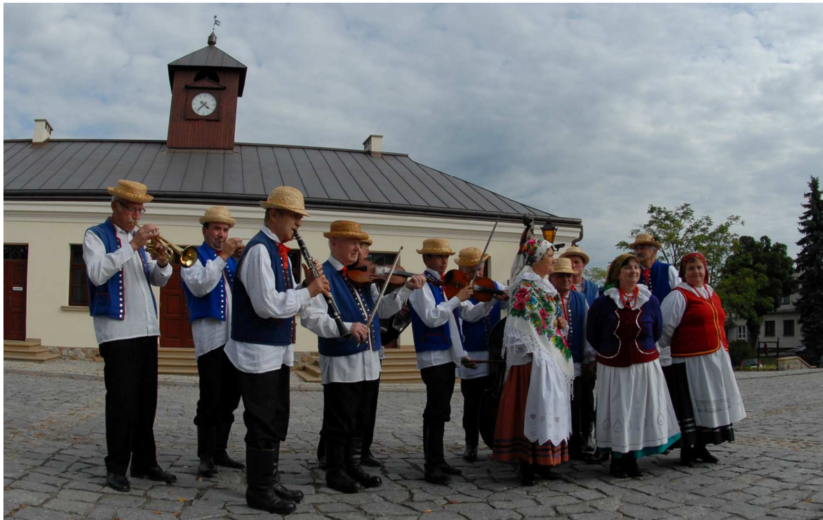
Ciężkowice, gmina Ciężkowice – klasycystyczny ratusz z XIX wieku

Zabytkowy układ urbanistyczny w centrum Ciężkowic obejmuje rynek, klasycystyczny ratusz oraz budynki mieszkalne . Od czworobocznego rynku odchodzi 8 ulic. Zachowana do czasów współczesnych zabudowa pochodzi z XVIII i XIX w. Ratusz jest czteroskrzydłowy, posiada wewnętrzny dziedziniec, przed nim znajduje się drewniana wieża. Jest to przykład budownictwa małomiasteczkowego z XIX w. W piwnicach ratusza zachowały się sklepienia kolebkowe.