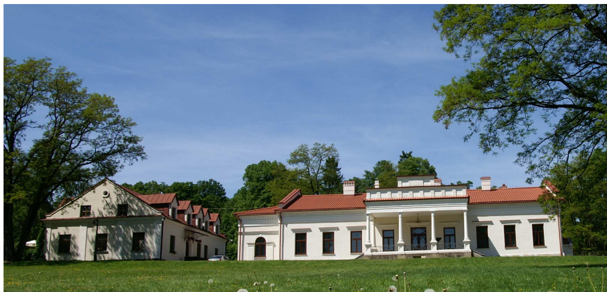
Kośna Dolna, gmina Ciężkowice – Dworek Ignacego Paderewskiego

Do rejestru zabytków dwór wpisano w latach 70. XX w. Następnie zabudowania dworskie wyremontowano, a oficynę zrekonstruowano. Obecnie w oficynie znajduje się dom pracy twórczej. Dwór jest także siedzibą Centrum Paderewskiego Tarnów – Kąsna Dolna. Jego działalność koncentruje się na upowszechnianiu kultury muzycznej poprzez koncerty, recitale, festiwale, warsztaty muzyczne, kursy mistrzowskie, sympozja, zjazdy, sesje naukowe.