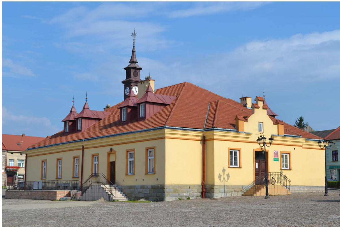
Zakliczyn, gmina Zakliczyn – ratusz z początku XIX wieku

można zobaczyć także na ulicach Różanej, Malczewskiego i Piłsudskiego, otaczających Rynek. Rynek w Zakliczynie jest miejscem organizacji cotygodniowego jarmarku.