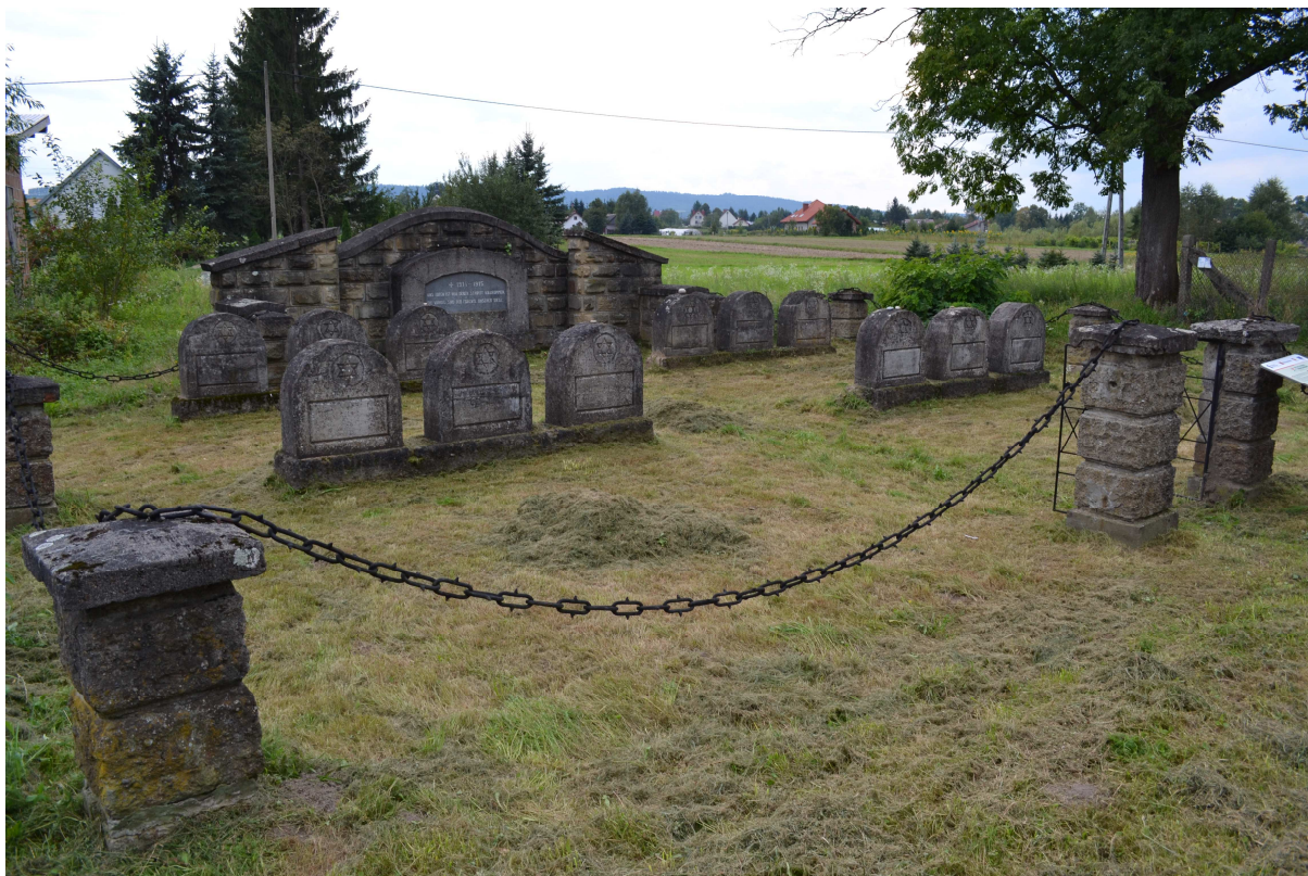
Zakliczyn, gmina Zakliczyn – cmentarz wojenny nr 293

Cmentarz wojenny nr 294 w Zakliczynie zajmuje kwaterę na cmentarzu parafialnym. Na betonowym krzyżu umieszczono napis: „Wierni w potrzebie - błogosławieni w śmierci”. Cmentarz jest miejscem pochówku żołnierzy austro-węgierskich i rosyjskich (poza kwaterą). Znajduje się tam również mogiła żołnierzy z 38 Pułku Piechoty Strzelców Wileńskich poległych w 1939 r. i mogiła porucznika Józefa Krupskiego z 2 Pułku 1 Brygady Legionów Polskich. Pomnik z orłem zrywającym się do lotu upamiętnia Kubę Bojarskiego, oficera Legionów Polskich.