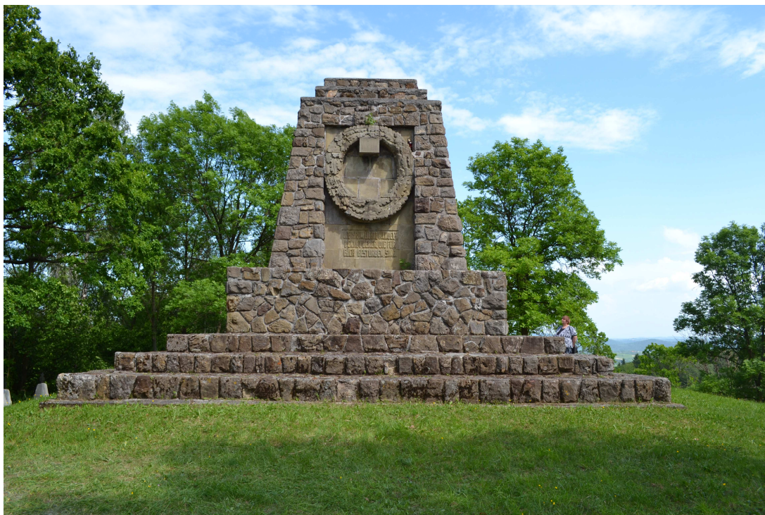
Lichwin, gmina Pleśna – cmentarz wojenny nr 185

W obrębie cmentarza wojskowego nr 187 spoczywają polegli żołnierze austro-węgierscy i rosyjscy. Znajduje się tu także miejsce spoczynku austriackiego malarza i grafika