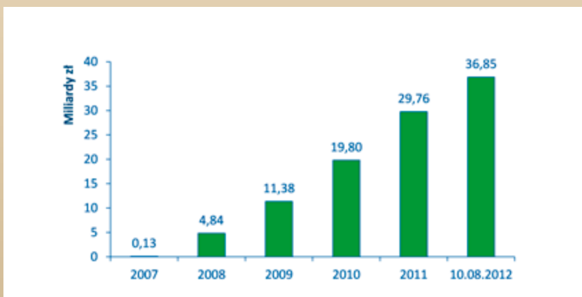
Wykres 2. Płatności zrealizowane w kolejnych latach (narastająco).

2007-2013 na dzień 10 sierpnia 2012 r. Zrealizowane płatności osiągnęły już prawie 37 mld zł. Stawia to Polskę wśród krajów wdrażających Program w najszybszym tempie