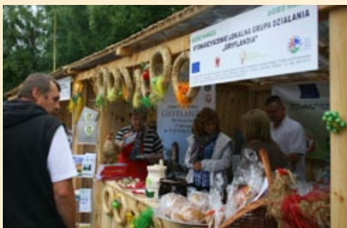
LGD z Pomorza Zachodniego prezentowały wytwory rzemieślnicze i artystyczne