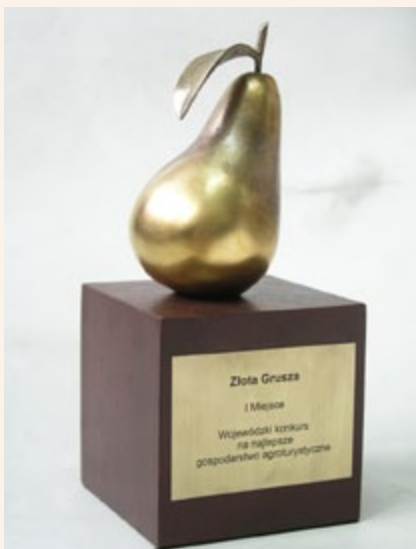
Konkurs na najlepsze gospodarstwo agroturystyczne „Złota Grusza”

Bogactwo łódzkiej wsi, jej walory kulinarne i rękodzieło artystyczne miały swoje święto podczas pierwszych, zorganizowanych przez nas warsztatów „Smaki Ziemi Łódzkiej”. Szeroko pojęte pojęcie smaków pozwoliło poznać i rozsmakować się w regionalnych potrawach prezentowanych przez Koła Gospodyń Wiej-