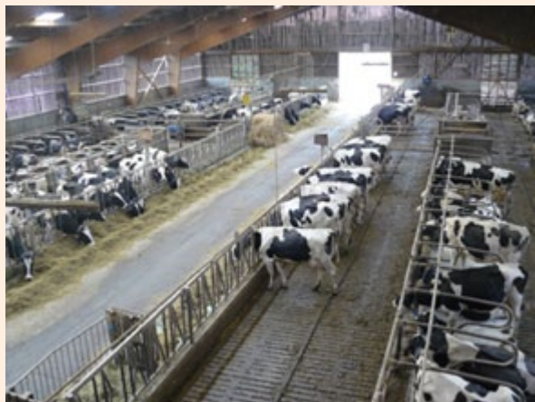
Wyjazd studyjny do Francji