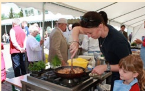
Konkurs „Na najlepszą potrawę z mąki” podczas Święta Agrokuchni