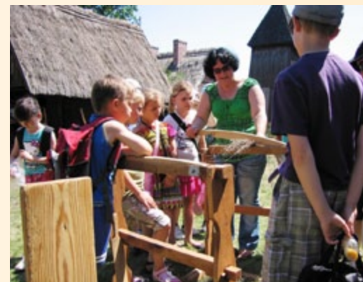
Muzeum Etnograficzne w Ochli

Odpowiedzi na trudne pytania dotyczące dawnych zawodów można było szukać w Muzeum Etnograficznym w podzielonogórskiej Ochli. Odbyla się tam tygodniowa impreza pod hasłem „Ginące zawody – warsztaty tradycji w domu, w polu i w zagrodzie”. Cykl warsztatów od 30 maja do 5 czerwca 2011 r. dał szansę bezpośredniego i czynnego uczestnictwa w kulturze naszych przodków gościom z Polski i zagranicy. W zabytkowych obiektach architektury wiejskiej, w przestrzeni zagród, łąk, pól i lasów, stworzono odwiedzającym turystom wyjątkową okazję przebywania w „ożywionych zagrodach”, gdzie prezentowane były dawne, wiejskie warsztaty gospodarskie, rzemieślnicze i rękodzielnicze, które przekazywane były w tradycji polskiej z pokolenia na pokolenie, którymi prawie nikt się nie zajmuje, a bez których sto lat temu ludzie by nie przeżyli. Podczas imprezy można było spróbować np. tradycyjnych placków z mąki mielonej na żarnach i wypiekanych w piecu.