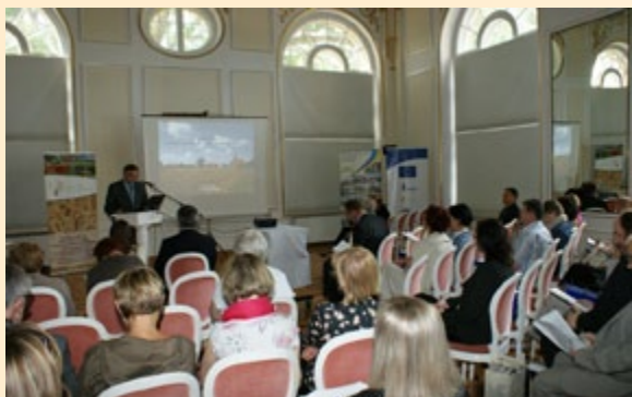
Uczestnicy konferencji „Wiejska przestrzeń – zagrożone dziedzictwo”