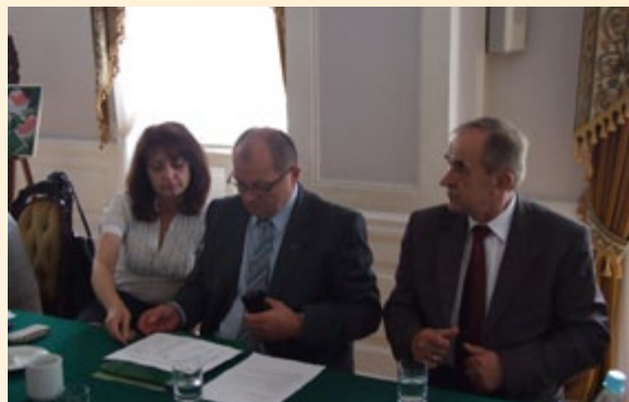
W Sterdyni z samorządowcami spotkał się Minister Marek Sawicki

We wrześniu i październiku br. najważniejszymi propozycjami SR KSOW będą: V Mazowiecki Kongres Rozwoju Obszarów Wiejskich, Dożynki Wojewódzkie w Wyszku, szkolenia dla Lokalnych Grup Działania oraz III Festiwal Miodu Ziemi w Sochaczewie. Więcej o tych i innych propozycjach na www.mazowieckie.ksow.pl