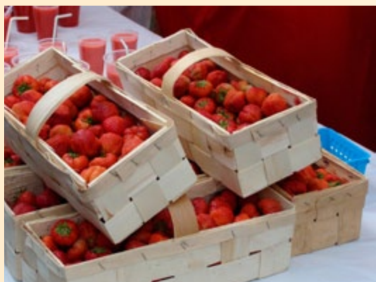
Truskawkobranie na Złotej Górze