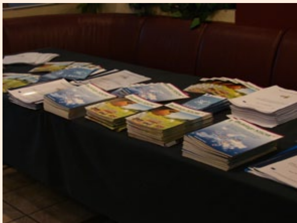
Materiały informacyjne na konferencji w Spale