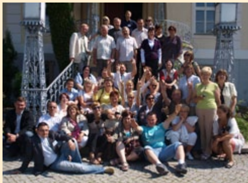
Uczestnicy wyjazdu na IV Polski Kongres Odnowy Wsi