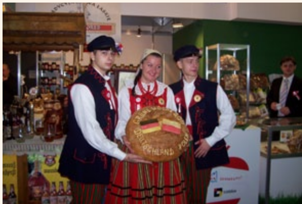
Województwo łódzkie na targach Grüne Woche w Berlinie

Marszałkowskiego w Łodzi. Minione miesiące to dla nas czas wypełniony szeregiem zdarzeń, w których poznawaliśmy się nawzajem (partnerzy KSOW), mówiliśmy na szerokich forach o problemach, z jakimi borykają się środowiska wiejskie, choćby problem masowego giniecia pszczół, ale mieliśmy też okazję wielokrotnie zaprezentować bogactwo łódzkiej wsi, jej walory kulinarne i przyrodnicze oraz ciekawych ludzi, bez których dziedzictwo naszych przodków, kultywowane przez lata, nie miałyby szansy dziś stanowić podstawy do prezentowania na arenie krajowej i zagranicznej. Każdego roku, i w bieżącym również, przedstawiciele sektora spożywczego, rolnego i ogrodnictwa regionu łódzkiego mieli możliwość zaprezentowania swojej oferty handlowej na targach Grüne Woche w Berlinie.