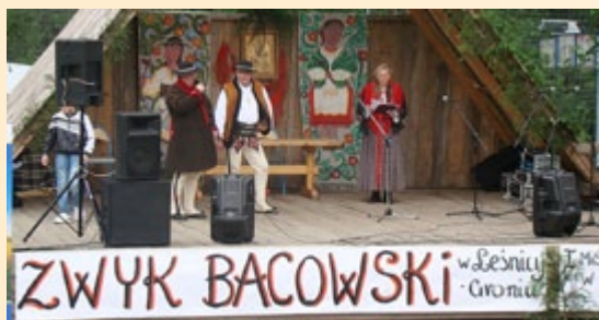
Mistrzostwa Polski w strzyżeniu owiec

ferencji zorganizowano warsztaty robocze w formie wyjazdów studyjnych do 6 subregionów Małopolski. W ten sposób pokazano różnorodne formy aktywności drobnych rolników. Ich celem była wymiana wiedzy między zaproszonymi gośćmi z zagranicy a przedstawicielami różnorodnych polskich instytucji zajmujących się rozwojem rolnictwa. W trakcie trwania wyjazdów studyjnych grupy robocze odwiedziły po dwa gospodarstwa o różnych profilach działalności: warzywnych, agroturystycznych, przemysłowych, sadowniczych i hodowlanych. Dodatkowo każda z grup roboczych miała okazję podyskutować z okolicznymi rolnikami i reprezentantami samorządów lokalnych na spotkaniach plenarnych. Dyskusje podczas spotkań koncentrowały się w głównej mierze na problemach, jakie napotykają małopolscy rolnicy w sięganiu po środki ze Wspólnej Polityki Rolnej. Konferencja zapoczątkowała dyskusję nad przyszłością drobnych gospodarstw rolnych w przyszłej Wspólnej Polityce Rolnej UE. Ponadto wszyscy uczestnicy tego wydarzenia mieli okazję do wymiany doświadczeń i poglądów na temat oczekiwań rolników co do przyszłych instrumentów wspierających WPR.