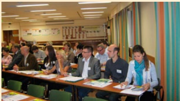
Wizyta LGD w Finlandii