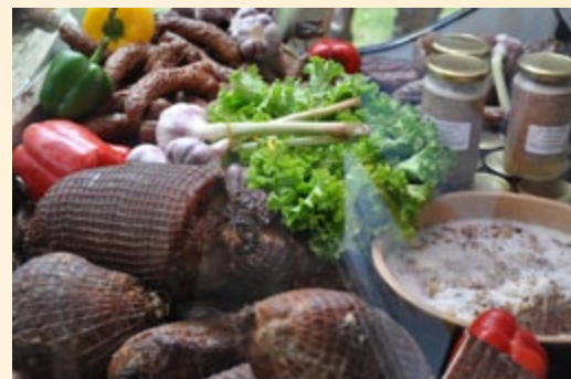
Jarmark produktów regionalnych i tradycyjnych

W Łagowie Lubuskim w dniach 30 czerwca – 3 lipca 2011 r. można było odwiedzić jarmark produktów regionalnych i tradycyjnych, który został zorganizowany w ramach promocji produktów lokalnych. Bogata oferta żywności pochodzącej z naszego regionu zyskuje coraz większą popularność i zainteresowanie konsumentów. Istotna jest to dla nas informacja, ponieważ wysoka jakość lokalnych produktów wytwarzanych metodą tradycyjną stanowi priorytet dla Unii Europejskiej. Podczas trwania jarmarku producenci z województwa lubuskiego mieli okazję zaprezentować swoje wyroby. Stanowiło to dla wszystkich biorących udział niebywałą okazję do skosztowania wina, piwa, wędlin regionalnych, chleba i innych produktów. Nie brakowało chętnych do degustacji, a możliwość zakupienia tych wyrobów czyniła imprezę jeszcze bardziej atrakcyjną.