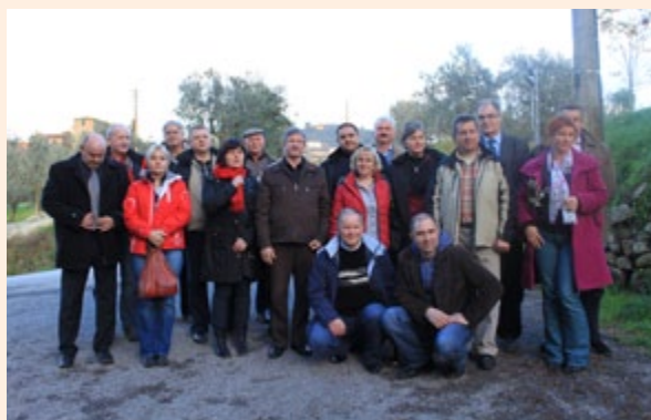
Wyjazd studyjny do Włoch

– Identyfikacja i analiza możliwych do przeniesienia dobrych praktyk w zakresie rozwoju obszarów wiejskich oraz przekazanie informacji na ich temat (Konferencja na temat prezentacji dobrych praktyk na rzecz rozwoju obszarów wiejskich, z uwzględnieniem ochrony środowiska – podkreślenie pozytywnej roli rolnictwa w walce ze zmianami klimatu) , np. konferencja w dniu 16 września 2010 r. w Spale pn. „Polskie rolnictwo w nowej perspektywie finansowej Unii Europejskiej w kontekście produkcyjnym i środowiskowym”, na której omówiono tematy odnoszące się do Wspólnej Polityki Rolnej po 2013 r., dobrych praktyk rolniczych na rzecz ochrony środowiska z uwzględnieniem zmian klimatycznych, zmiany kryteriów wyznaczających obszary o niekorzystnych warunkach gospodarowania