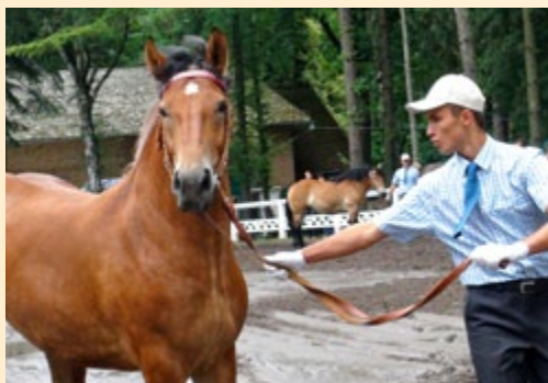
Prezentacja podczas Czempionatu Koni