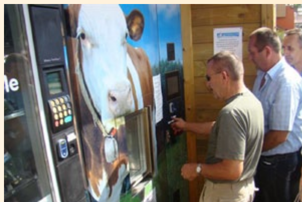
Wyjazd studyjny do regionu Rhône-Alpes

W wyjeździe studyjnym do partnerskiego regionu Rhône-Alpes w dniach 13-20 czerwca uczestniczyło 25 przedstawicieli Lokalnych Grup Działania oraz pracownicy Urzędu Marszałkowskiego i Centrum Doradztwa Rolniczego. W trakcie wizyty doszło do spotkań z urzędnikami reprezentującymi władzę regionalną, obecni byli również członkowie związków gmin i stowarzyszeń. Szczególnie cenne dla uczestników wyjazdu do Rhône-Alpes były spotkania z tamtejszymi beneficjentami działań Leader, a także spotkania z członkami LGD funkcjonujących w tym regionie. Innym interesującym elementem wyjazdu była prezentacja projektu pn. „Fontanna mleka” oraz wspólny punkt sprzedaży dla rolników.