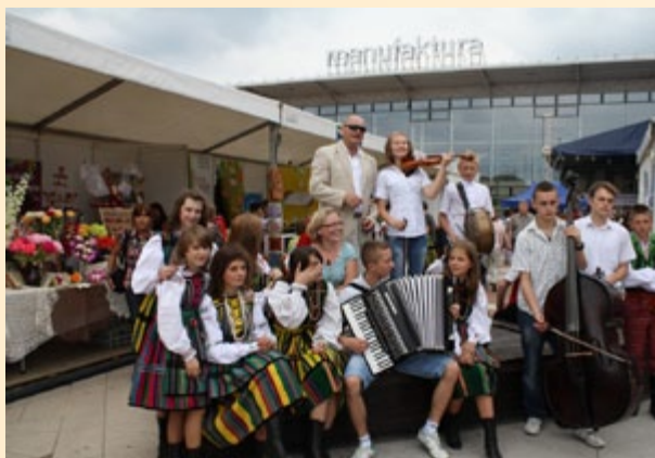
Warsztaty produktów regionalnych

było w czym wybierać. Wszyscy zainteresowani smakiem produktów tradycyjnych posiadających wpis na listę prowadzoną przez MRiRW mieli wiele sposobności, by skosztować chleba nagawskiego wiecznie świeżego, koziego twarogu z Eufeminowa, miódów z doliny Mrogi, piwa żywego, soku jabłkowego z Kałęczewa i wielu innych. Wiele emocji wzbudzały występy zespołów folklorystycznych, które tego dnia walczyły o statuetkę Folknuty. Wybór zwycięzców nie należał do najłatwiejszych. Komisja konkursowa musiała wybrać spośród 34 zgłoszonych do udziału w konkursie zespołów. Na podium stanęły trzy zespoły, które otrzymały z rąk Marszałka Województwa Łódzkiego statuetki Folknuty oraz podziękowania za trud włożony w kultywowanie