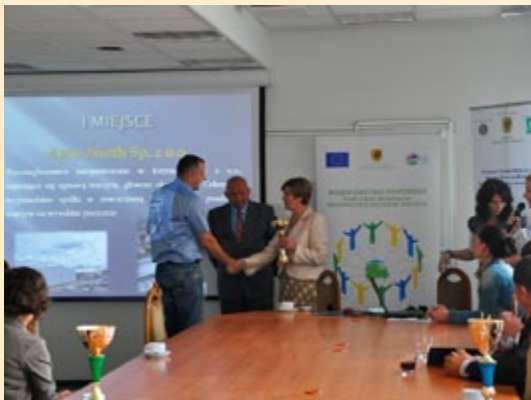
Konkurs na najlepszy projekt realizowany w ramach OR ARiMR