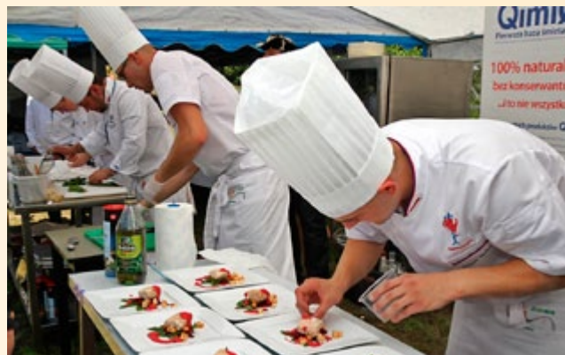
Festiwal Smaku w Grucznie

Sekretariat Regionalny Krajowej Sieci Obszarów Wiejskich Województwa Kujawsko-Pomorskiego był współorganizatorem imprezy pt. „Kujawsko-Pomorskie Miodowe Lato, Zarzeczewo 2011”, która odbyła się 14 sierpnia 2011 r. w Zarzeczewie k. Włocławka. Zorganizowane po raz drugi święto miodu miało na celu popularyzowanie wspaniałych właściwości różnych gatunków miodów pochodzących z regionu Kujaw i Pomorza. W imprezie licznie uczestniczyli pszczelarze oraz miłośnicy produktów pszczelarskich, którzy mieli możliwość degustacji i zakupu, ale również poszerzenia swojej wiedzy o ich wykorzystaniu w żywieniu i kosmetyce. W trakcie imprezy odbyły się warsztaty rękodzielnicze, kulinarne, pokazy „gotowania w parku”, wyrobu świec i ozdób z wosku, odwirowywania miodu oraz wypieku tradycyjnego ciasta piernikowego. Podczas Kujawsko-Pomorskiego Miodowego Lata rozstrzygnięto konkursy: „Miodowe pyszności”, „Miód sezonu” i „Pszczola w obiektywie”, konkurs wiedzy o pszczelarstwie.