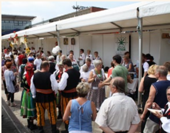
Wspieranie produktów tradycyjnych – „Smaki Ziemi Łódzkiej”