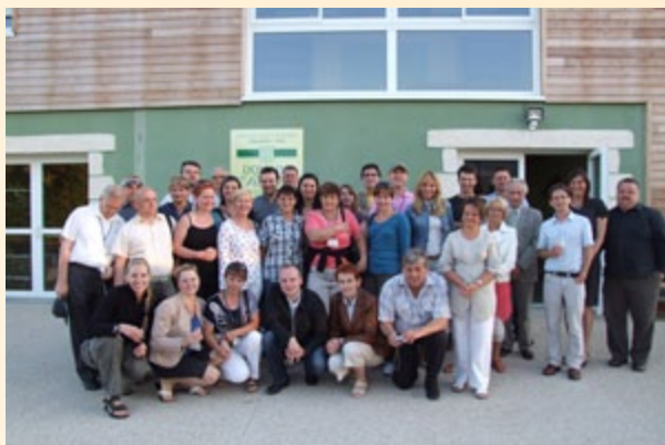
Wizyta studyjna we Francji

W dniach 29-30 czerwca 2011 r. w Białowieży odbyła się konferencja „Leader szansą na zrównoważony rozwój Podlasia”. Spotkanie było realizowane w ramach współpracy województwa podlaskiego z Lokalnymi Grupami Działania. Tematem konferencji było omówienie kwestii przekazywania środków na realizację lokalnych strategii rozwoju. Główny cel konferencji to podsumowanie dotychczasowych działań LGD funkcjonujących na terenie województwa podlaskiego. Ponadto dokonano podsumowania działań samorządu województwa we wdrażaniu osi 4 Leader PROW 2007-2013. Konferencja przybliżyła także perspektywy realizacji działań KSOW na lata 2012-2013. Spotkanie było ponadto szansą do zaprezentowania dotychczasowych dokonań Lokalnych Grup Działania, wymiany doświadczeń, prezentacji dobrych praktyk, jak również stanowiło okazję do zacieśnienia dalszej współpracy pomiędzy podlaskimi LGD.