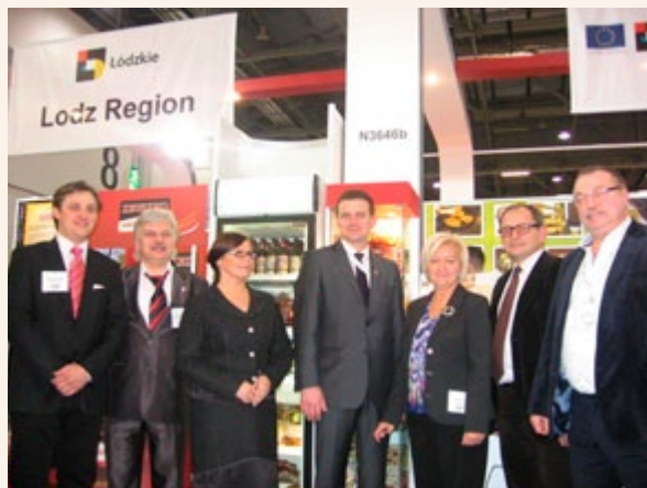
Na targach IFE w Londynie

Organizacja konkursów jest stałym elementem Planu łódzkiej sieci KSOW. To również doskonała okazja do integracji jej partnerów. Każdego roku, wspólnie z KRUS, Okręgowym Inspektoratem Pracy, Powiatową Inspekcją Pracy i Izbą Rolniczą, promujemy zasady ochrony zdrowia i życia w gospodarstwach rolnych. Podsumowanie konkursu to wyłonienie wyróżniających się, bezpiecznych miejsc życia i pracy i uhonorowanie ich praktycznym, niezbędnym w każdym gospodarstwie rolnym sprzętem, zakupionym ze środków KSOW. Jak ważne jest bezpieczeństwo działalności rolniczej i świadome, oparte na nowoczesnych, naturalnych zasadach gospodarowanie, wiedzą uczestnicy olimpiad organizowanych przez Ośrodek Doradztwa Rolniczego wspólnie z SR KSOW. Olimpiady kierowane są do rolników, ale i do środowiska młodzieży szkolnej szkół rolniczych, której wzrost świadomości istoty działalności w zgodzie ze środowiskiem jest niezwykle ważny. Łódzkie olimpiady obejmują takie dziedziny, jak: ekologiczna produkcja rolnicza, zasady cross-compliance, ochrona