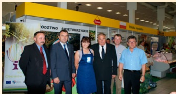
Delegacja województwa świętokrzyskiego na targach Agrokomplex