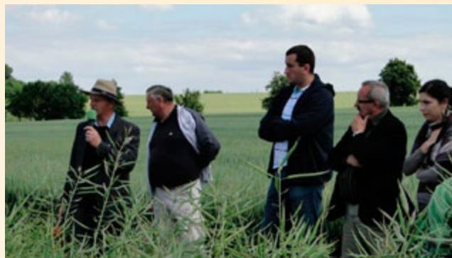
Uczestnicy konferencji „Euro-Raps 2011”

Podczas paneli dyskusyjnych uczestnicy debatowali m.in. na temat: przyszłości Wspólnej Polityki Rolnej po 2013 r. w kontekście stabilizacji produkcji roślin oleistych, perspektyw uprawy rzepaku w Europie i na świecie oraz rozwoju rynku biopaliw.