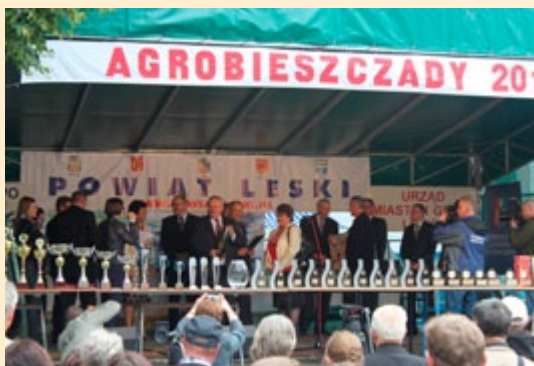
XVI edycja Targów Rzemiosła i Przedsiębiorczości AGROBIESZCZADY 2011