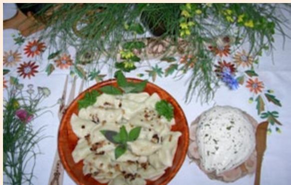
Pierogi i ser

Każdy z obiektów posiada indywidualną ofertę noclegową i gastronomiczną. Ceny noclegów w gospodarstwach wahają się w granicach od 20 do 50 zł, a cena za całonocne wyżywienie – od 20 do 60 zł. Na