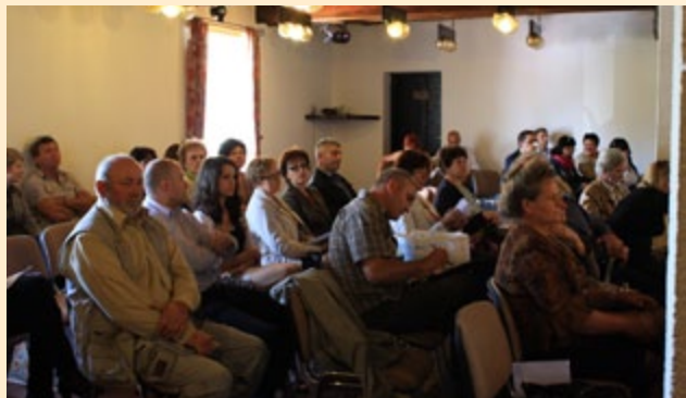
Konferencja na temat rozwoju turystyki

Krajowej Sieci Obszarów Wiejskich Województwa Łódzkiego wspólnie z Departamentem Kultury Fizycznej, Sportu i Turystyki Urzędu Marszałkowskiego w Łodzi. Do Hotelu Podklasztorze w Sulejowie przybyła grupa właścicieli gospodarstw agroturystycznych, przedstawiciele Lokalnych Grup Działania oraz osób zainteresowanych rozwojem turystyki na obszarach wiejskich w regionie łódzkim. Program konferencji obejmował zagadnienia, których konieczność poruszenia zgłaszały środowiska związane z turystyką tj.: pozyskanie funduszy zewnętrznych na rozwijanie usług turystycznych, nazewnictwo obiektów noclegowych i ich kategoryzacja,