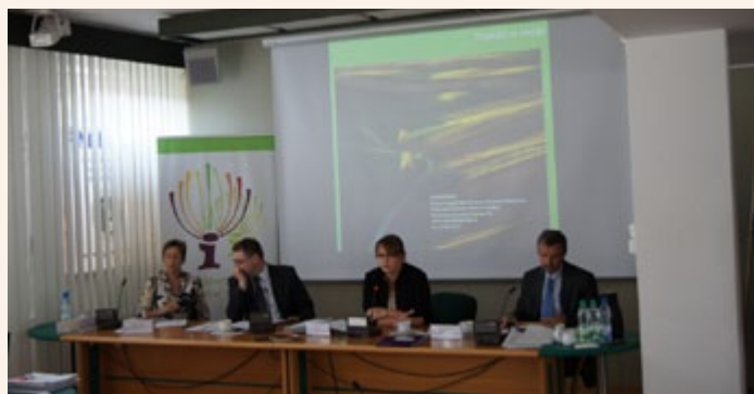
Prezydium VII posiedzenia Grupy Roboczej ds. KSOW