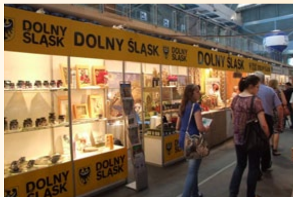
Dolnośląskie na targach EKOLOGA 2011

W dniach 20-22 maja 2011 r. w Rzeszowie odbyła się piąta edycja Międzynarodowych Targów Produktów i Technik Ekologicznych EKOLOGA 2011. Stoisko województwa dolnośląskiego cieszyło się wielkim zainteresowaniem odwiedzających targi gości związanych z tematyką żywności oraz wyrobów ekologicznych. Na stoisku województwa dolnośląskiego prezentowane były wyroby z lnu, przedsiębiorstwa „Świat Lnu”, kozie sery z Ekologicznego Gospodarstwa Sadowniczego „Malinowa Zagroda” oraz sery z Gospodarstwa Agroturystycznego „Wańczykówka”, a także przetwory z ekologicznej aronii z firmy „Eko-Ar”. Szeroka i ciekawa oferta wystawców oraz atrakcyjny wygląd stoiska skupiały uwagę odwiedzających targi gości oraz przedstawicieli mediów. Udział województwa dolnośląskiego w tej imprezie w znacznym stopniu przyczynił się do rozpropagowania dolnośląskich produktów ekologicznych oraz do zaznaczenia obecności naszego województwa w gronie tych regionów, które w aktywny sposób dążą do rozwoju oraz szerokiej promocji wyrobów ekologicznych. Szeroka gama produktów prezentowanych na stoisku województwa dolnośląskiego była sygnałem dla odwiedzających targi gości, że Dolny Śląsk może zaproponować interesującą ofertę tak artykułów spożywczych, jak również innych wyrobów ekologicznych. Sukces wystawców oraz wielkie zainteresowanie stoiskiem przyczyniły się do promocji województwa dolnośląskiego wśród gości z różnych regionów Polski, a także z zagranicy.