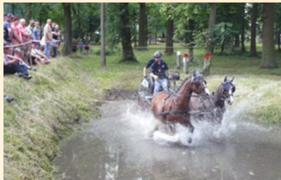
Zawody w powożeniu

Nie tylko hodowcy i producenci powozów, ale także zaproszona na to wydarzenie publiczność mogła podziwiać prawdziwy kunszt startujących w zawodach ludzi i koni, zarówno w konkurencjach sprawnościowych, jak i szybkościowych. O dużej randze tego spotkania świadczy udział w zawodach w powożeniu mistrzów Polski i mistrzów świata. Niezwykle widowiskowe były zawody powożenia w wypełnionej wodą fosie, a także kaskaderskie popisy jeźdźców, którzy zadziwiali publiczność sprawnością i brawurą w ujeżdżaniu koni. Na uczestników spotkania czekało także sporo atrakcji podczas wieczornej gali. Impreza „Konie i powozy” w znakomity sposób kultywuje tradycje nieodłącznie związane z hodowlą koni i jest przykładem działania Krajowej Sieci Obszarów Wiejskich realizującej priorytet KSOW związany z podtrzymywaniem tradycji regionalnych i lokalnych.