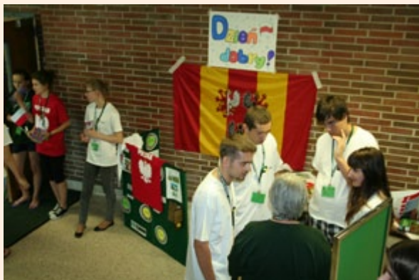
Wymiana młodzieży z USA