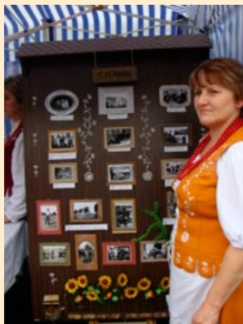
II Powiślański Turniej Gmin