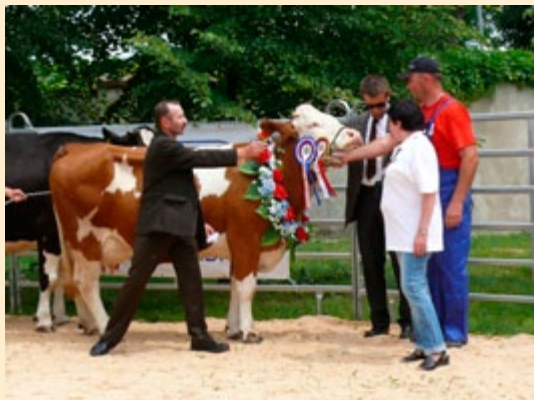
XIII Regionalna Wystawa Zwierząt Hodowlanych