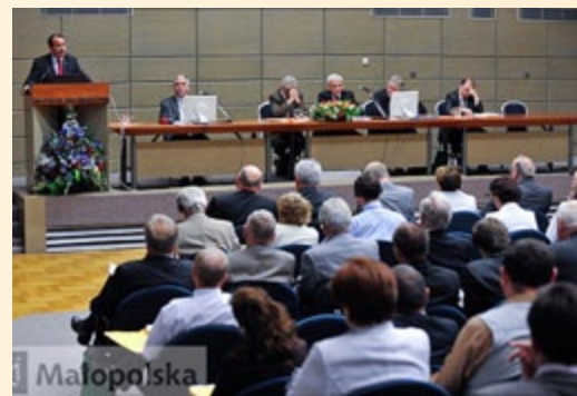
Uczestnicy konferencji nt. przyszłości drobnych gospodarstw rolnych w UE

W dniach 8-9 lipca br. odbyła się międzynarodowa konferencja pn. „Teraźniejszość i przyszłość drobnych gospodarstw rolnych w Unii Europejskiej”. Spotkanie zorganizowane zostało z inicjatywy Ministra Rolnictwa i Rozwoju Wsi oraz polskich eurodeputowanych zajmujących się tematyką przyszłości Wspólnej Polityki Rolnej. W pierwszym dniu konferencji odbyła się sesja plenarna, podczas której żywo dyskutowano o roli, jaką pełnią i mają w przyszłości pełnić drobne gospodarstwa rolne. Wszyscy prelegenci podkreślali, iż niemożliwe jest uniwersalne zdefiniowanie drobnych gospodarstw dla wszystkich krajów członkowskich UE. Każde państwo ma bowiem swoją specyfikę rolnictwa i to od decyzji wewnętrznych struktur zależeć powinno zaliczenie gospodarstw do kategorii małych bądź dużych. W drugim dniu kon-