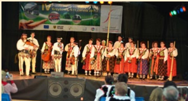
Kongresowi towarzyszyła bogata oprawa artystyczna