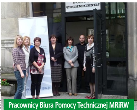
Pracownicy Biura Pomocy Technicznej MRiRW

W dniach od 10 do 11 maja 2010 r. w Ośrodku Szkoleniowo–Wypoczynkowym EXPLORIS w Serocku odbyła się dwudniowa konferencja, której tematem było podsumowanie dotychczasowego stanu wdrażania pomocy technicznej PROW 2007–2013 oraz wypracowanie propozycji dotyczących dalszej realizacji zadań w zakresie pomocy technicznej. W ww. konferencji, jako goście, udział wzięli przedstawiciele wszystkich podmiotów będących beneficjentami pomocy technicznej PROW 2007–2013 zaś w roli prelegentów przedstawiciele Biura Pomocy Technicznej MRiRW oraz Departamentu Pomocy Technicznej ARiMR. Podczas pierwszego dnia konferencji omówiony został stan wdrażania pomocy technicznej PROW 2007–2013 oraz najczęściej pojawiające się błędy we wnioskach beneficjentów. Ponadto przedstawiona została część zagadnień zgłoszonych przez beneficjentów na konferencję, w tym: sposób przekazywania beneficjentom PT informacji o zmianach w procedurach, wzorach wniosków itp., umieszczanie na stronie internetowej interpretacji Wytycznych oraz przepisów, problem braku kwalifikowalności podatku VAT, kontrola na miejscu wniosku o płatność, zwiększenie alokacji na Schemat I, przesunięcie środków pomiędzy schematami pomocy technicznej,