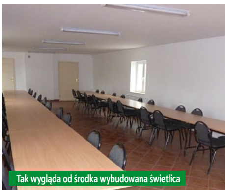
Tak wygląda od środka wybudowana świetlica

Impulsem do wprowadzenia działania „Odnowa wsi oraz zachowanie i ochrona dziedzictwa kulturowego” najpierw do Sektorowego Programu Operacyjnego „Restrukturyzacja i modernizacja sektora żywnościowego oraz rozwoju obszarów wiejskich 2004–2006” (SPO), a następnie działania „Odnowa i rozwój wsi” objętego PROW 2007–2013, był sukces Programu Odnowy Wsi Opolskiej zorganizowanego przez samorząd województwa w 1997 r., którego efektem są odnowione wsie opolskie stanowiące dumę mieszkańców.