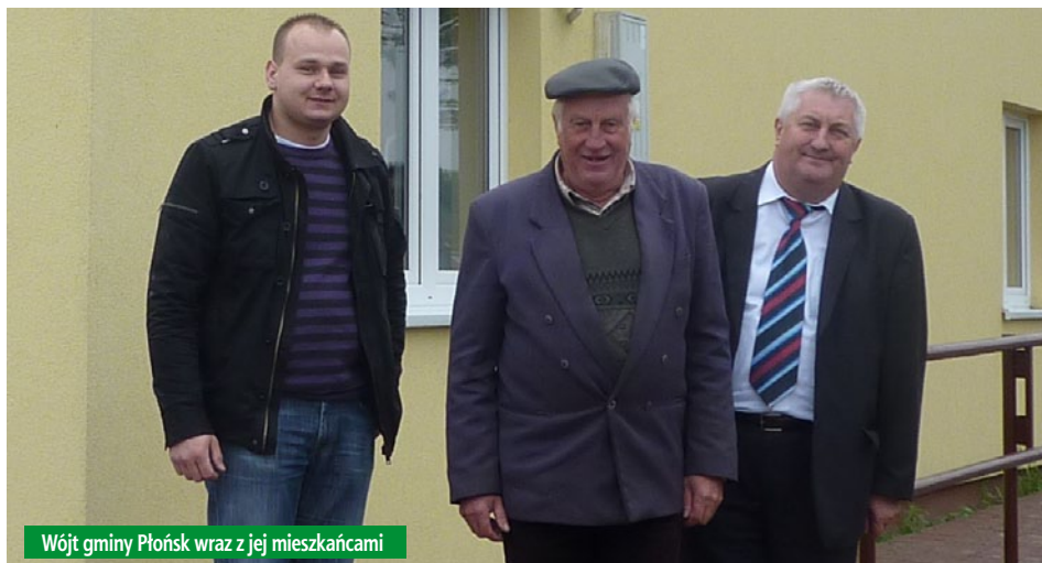
Wójt gminy Płońsk wraz z jej mieszkańcami